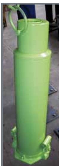
Gato de botella de 2 velocidades de larga carrera. 50 Tn de capacidad.