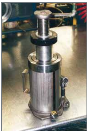
Gato de botella con tuerca de bloqueo.